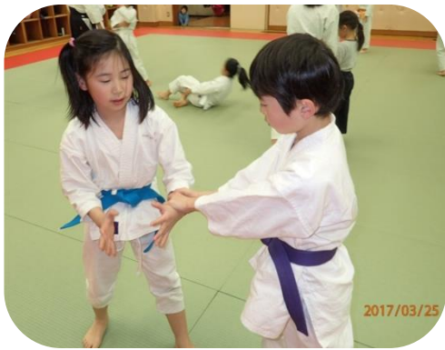
活動としましては、市立体育館、及び洗心館「合気道等にて」

吹田市の皆さま、こんにちは。吹田市合気道連盟です。合気道は、開祖植芝盛平翁先生（1883～1969年）が日本古来の武術等をもとに始められた武道です。世界大戦の経験からそれまでの武術のように他人の生命を奪うためのものではなく、平和、和合を中心におく、新しい武道であると言われています。また、世界130ヶ国（2014年）で老若男女、多くの方々が合気道の稽古に励んでおられます。当連盟は合気道普及発展のため、昭和55年に発足し、現在は阿部豊雲を理事長に活動を続けています。主な