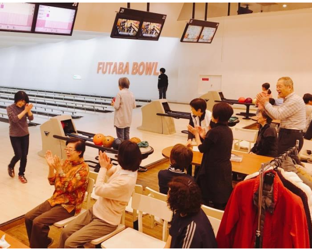
惜しみない応援と賞賛の拍手。

1F 和食レストラン 「さつき」 吹田市文化会館 2F 洋食・喫茶 「いずみ」 (メイシアター内)